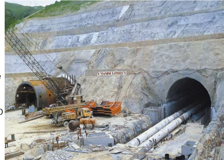
Gallerie Junk Bay