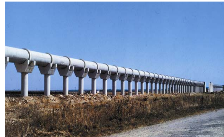
Acquedotto del Pertusillo